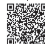
埼玉栄中学・高等学校

〒331-0078 埼玉県さいたま市西区西大宮3-11-1 URL: https://www.saitamasakae-h.ed.jp/